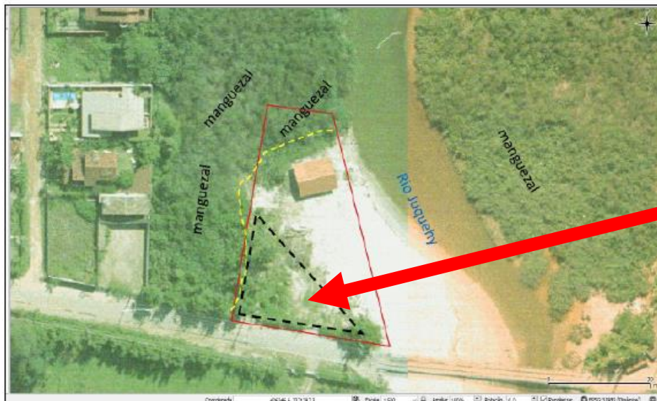
Figura 4. Ilustração da interface entre a feição de restinga e os manguezais existentes no interior e entorno da área em tela, a partir de aerofotografia datada de 1999, oriunda do banco de dados da prefeitura de São Sebastião. O tracejado amarelo ilustra a interface da área de restinga com a vegetação de mangue, e o tracejado azul ilustra o local aproximado onde veio a ser implantado aterro e pavimentação do estacionamento mais recentemente.

Imagem 3. demarcação do manguezal existente na área objeto dos autos.