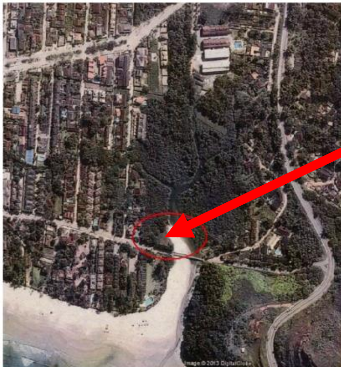
Imagem 4. Ilustra a densa vegetação nativa da APP do Rio Juquehy a montante do hotel e da Av. Mã Bernarda, sendo que a área sub judice destoa completamente do contexto diante da manutenção de intervenções que impediram a regeneração natural da APP ao longo dos anos.